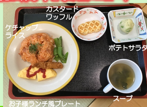
お子様ランチ風プレート