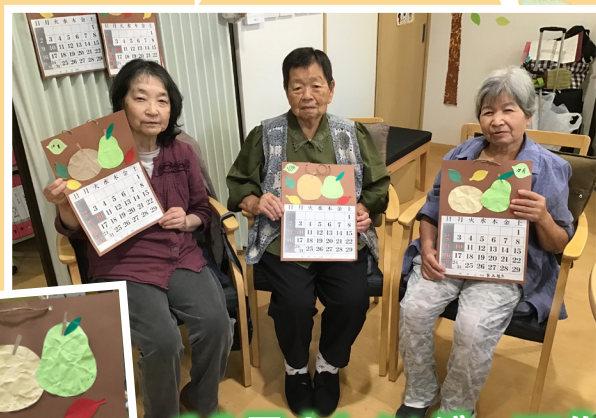
10月カレンダー工作