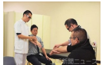
＜上毛新聞 2020年1月14日(火)＞

世界保健機関(WHO)によると、鍼灸治療は神経症や頭痛、めまいなど、計50以上の症状の緩和に有効とされ、一部の疾患は国内で公的保険の適用が認められている。